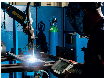
Soldadura MAG robotizada

A solução de gás de proteção de alto desempenho para a soldadura MAG com alta velocidade de aço ao carbono