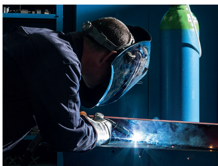
Soldadura MAG manual